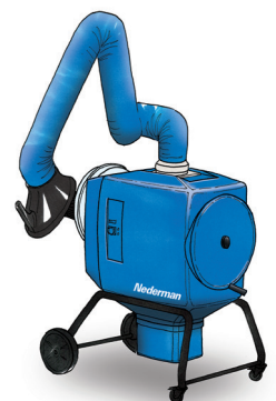
FilterBox 12 M Kostenefficiënte unit met handmatige filterreiniging en krachtige ventilator voor zwaardere toepassingen