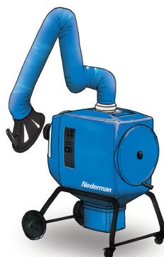
FilterBox 10 A Unit met automatische filterreiniging voor lichte tot middelzware stof- en dampstoepassingen