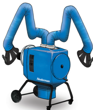
FilterBox Twin De economisch voordelige oplossing voor lichte tot middelzware toepassingen voor twee werkplekken