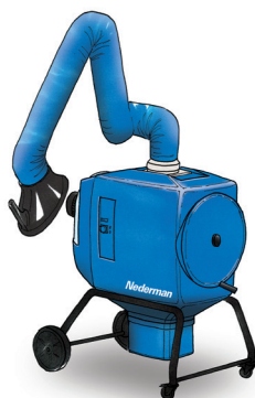
FilterBox 10 M Kostenefficiënte unit met handmatige filterreiniging voor lichte tot middelzware stof- en dampstoepassingen