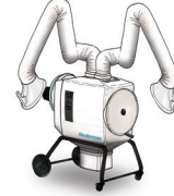
FilterBox Hygiene Twin