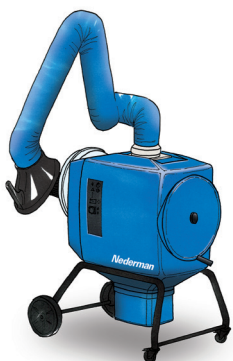
FilterBox 12 A Unit met automatische filterreiniging voor zwaardere stof- en damptoeepassingen

FilterBox is ook geschikt voor dampen die vrijkomen bij het lassen van RVS (chromgehalte >30%) en voldoet aan de OSHA-eisen voor chroom (VI).