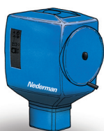
FilterBox Wall Veelzijdige unit zonder afzuigarm voor aansluiting op externe ventilator