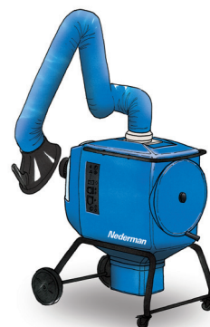
FilterBox 10 eQ Hoogwaardige ergonomische unit voor lichte tot middelzware stof- en dampstoepassingen